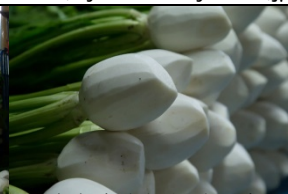
皮むきされたすぐき