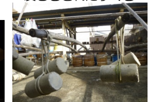
本漬けの様子(てこの原理を利用)