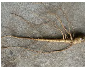
トコロアオイ調整後