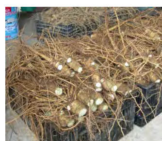
トコロアオイ出荷物