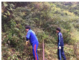
耕作放棄地の再生