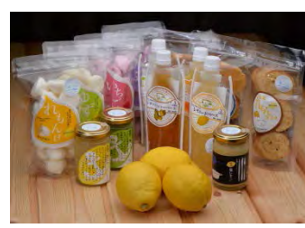
開発したレモン加工品