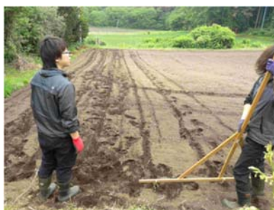
実習生の受け入れ