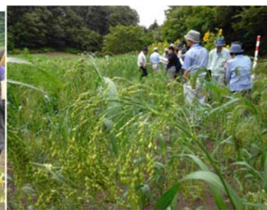
契約栽培農家のキビ栽培圃場にて契約農家の研修会