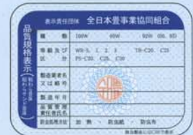
稲わら畳床、稲わらサンド畳床の証紙